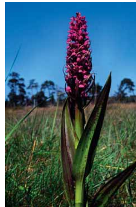
Ovan: Blodnycklarna omkring Alnäsa träsk är ståtligare och färgrikare än någon annan stans.

Vandringen över fastmarksåkrarna ner till stranden bjöd trots torkan på en hel del intressant. Här blommade korn- och rågvallmo, nicktistel och flera numer mycket sparsamt förekommande åkerogräs. Nere i skogsbrynet vittnade orkidéerna brudsporre,