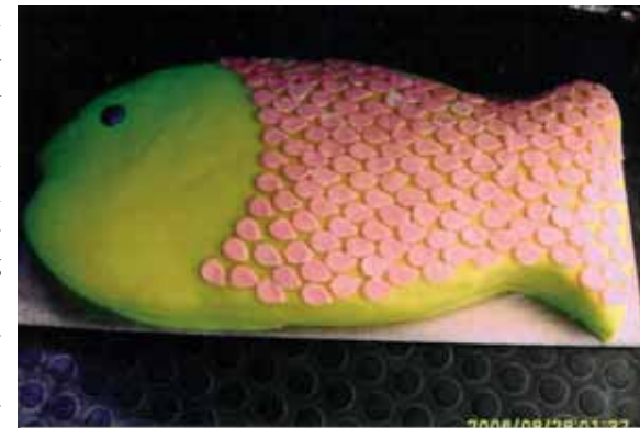
Färgglad "Fishtëarta" i marsipan, bakad i bageriet Sylvis Döttrar.

Styrelsen har engagerat sig i nybyggandet och vattenfrågan på Fårö och i januari skrev styrelsen ett brev till Byggnadsnämnden, Gotlands kommun. Vid fagningen i Mölnarve 28 april deltog ett 10-tal medlemmar. Vid Sjöräddningsmuseet i Ekeviken har skogsrojning skett och vägen har förbättrats. Sjöräddningsmuseet har haft öppet lördagar och söndagar, kl. 13.00-16.00 från och med midsommardagen till och med 10 augusti. Efterfrågan på vykort har under åren varit stor och under samma-