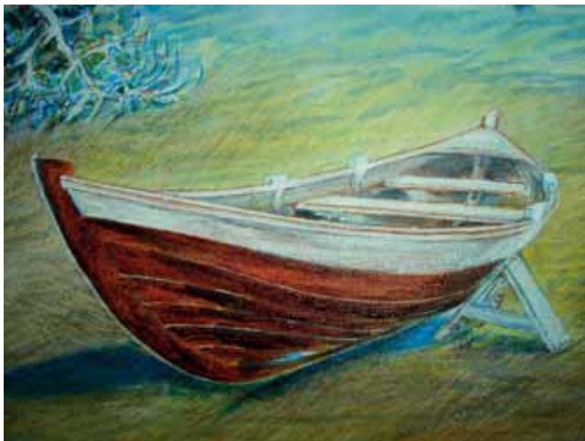
En detalj ur en större gammal målning.

I sommar var det femte gången och tredje året i rad som hembygdsföreningen ordnade en föreläsningkväll till ett hundratal bilder i ämnet Fårö i bildkonsten – från medeltid till nutid. Föreläsningen och urvalet av bilder har varierat under de tre åren, men publiken har varje gång roats av att se porträttbilden från 1400-talet som vi fann i biblioteket i Florens och som sannolikt visar munken Christoforo Buondelmonti, den konstnär som, så vitt vi vet, är den förste