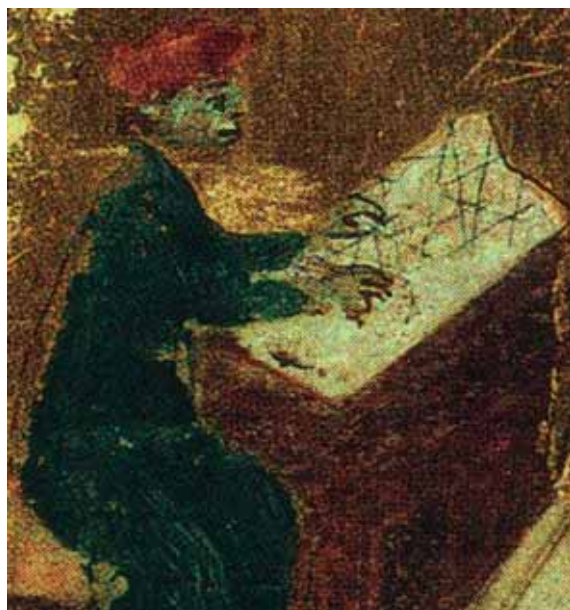
Christoforo Buondelmonti var den förste, så vitt vi vet, som ritade in Fårö i en kartbild i början av 1400-talet. Den här porträttbilden är, inte helt säkert men sannolikt, Buondelmonti i arbete. Han skrev in Fårö med "Fauroh" i sin kartbild.

Med åren har vi nu inom hembygdsföreningen samlat och noterat ett hundratal olika konstnärnamn och vi har cirka femhundra bilder på olika verk. Det är både kända och okända