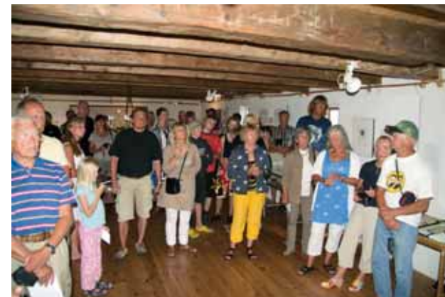
Besökare vid invigningen av den arkeologiska utställningen vid Bondans.

en mängd arkeologiska fynd tagits tillvara. Under två veckor, 28 juli till 9 augusti ställdes fynden ut på Bondans. Ungefär 1000