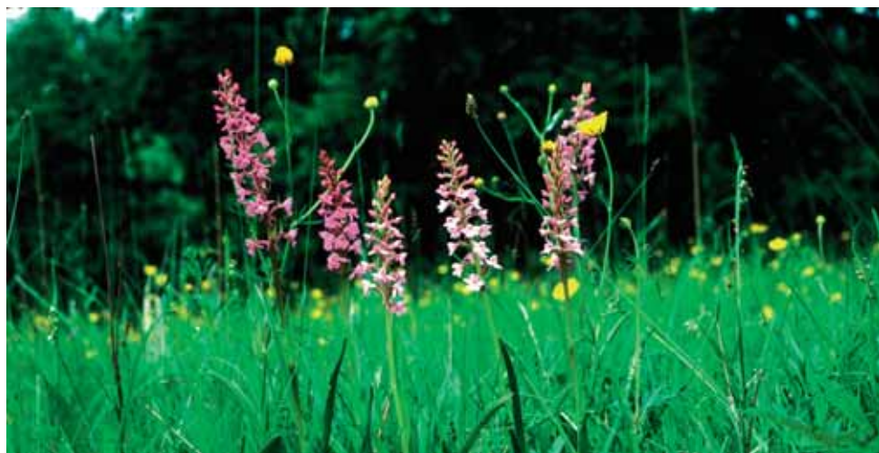
Strax ovan stranden vid Alnäsa träsk visar förekomsten av brudsporrar, att detta en gång varit slåttermarker.