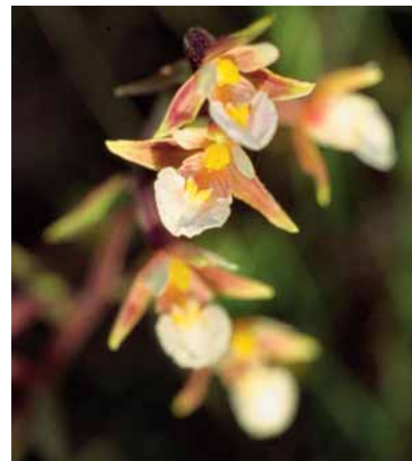
T.v.: Den glänsande vita kärnkniptonen är som en miniatyr av en odlad tropisk orkidé.